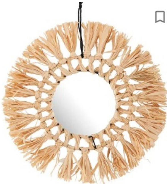
RAFFIA Spiegel naturel

Tijdens het bouwen en onderhouden van je Dossier, word je snel wijzer.