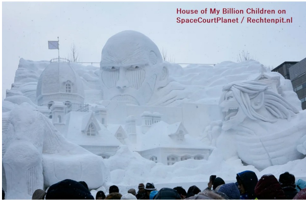
House of My Billion Children on SpaceCourtPlanet / Rechtenpit.nl

asiasociety.org/blog/asia/8-photos-japans-annual-ice-sculpture-winter-wonderland